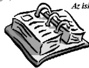
Az iskola tantestülete

kulás és farsangi bál, Ki mit tud, akadályverseny, gyereknap, anyák napi ünnepség és október 23-i, március 15-i megemlékezés, ballagás).