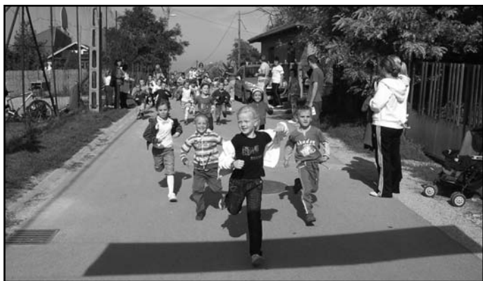
Az ovisok is futottak

Úrhida – Lefutotta a kijelölt több kilométeres távot községünk fiatal csapata. Az „1. Fut a falu” versenyen, melyet szeptember 24-én rendeztünk meg településünkön több mint kétszáz óvodás és iskolás korú gyermek állt rajthoz, akik már hetek óta készültek a feladatra.