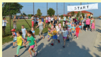
Az ovisok is elindultak

A futamok kavalkádja az ovis, 300 méteres futással kezdődött. Utánuk sorban indultak az összevont iskolai osztály kategóriák 600-1500 méteres távokon. A versenynek ismét a Zrínyi kör néven ismert szakasz adott helyszínt, ahol némi szintkülönbséggel is meg kellett küzdeniük a futóknak, de a cél előtti egyenes lehetőséget teremtett a végső hajrázásra. A lelkes szülői nézősereg többször is izgalmas befutókat láthatott kis sportolóinktól.