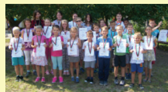
A győztesek csapata

A távok megtétele után a célba érkezők vidáman mesélték futás közbeni élményeiket egymásnak, majd felfrissülve folytatták a napjukat az intézményekben. Köszönet mindenkinek a részvételért és reméljük, hogy még sokszor találkozunk velük más sport rendezvényeinken is!