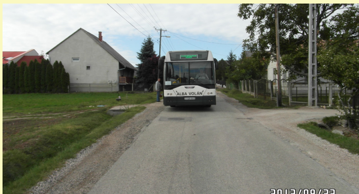
Reményeink szerint a jövő évben befejeződik a Kossuth utca felső szakaszának komplex felújítása.

A pályázat támogatásáról szóló döntésről november 04-én értesültünk, a hivatalos bejelentésre december 02-án a megyeházán került sor. Az építés a kis Jókai utcától, a Dózsa utcai elágazó közötti szakaszt érinti, a beruházás sajátossága, hogy kerítéstől kerítésig tart. Kivitelezés tekintetében hasonlóképpen, mint az előző szakaszon, az út jobb oldalán lesz kialakítva a zárt csapadékvíz-elvezető csatorna és felette az útburkolattól kiemelt szegéllyel elválasztott 1,5 méter széles járda. Az útburkolat a jelenlegi 4 méterrel 5,5 méterre szélesedik. Ezek következtében az út nyomvonala és a szintje is megváltozik. Azért, hogy a kiépített szennyvízcsatorna nyomvonalán a későbbiekben megsüllyedések ne jöjjenek újra elő, teljes útalap építéssel számolunk, és a kivitelezés során szeretnénk kicserélni az ivóvizet biztosító eternit csővezetékét is.