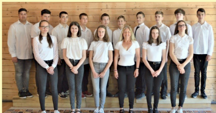
2013 - 2021 Úrhida

A tanévzárókat járványveszély miatt nem hagyományos formában rendeztük meg, hanem osztályonként. A tanévzárással kapcsolatos néhány fontos dolgot kiemelnek. Iskolánk tanulmányi átlageredménye nagy örömmel az előző évhez hasonlóan magas 4,41. Tagozatonkénti megoszlása a következő: az alsóban 4,53, a felsőben: 4,33. A nyolcadik osztályosok pályaválasztása sikeresen lezárult, a tanulóink 80%-át vették fel a jelentkezési lapon megjelölt 1. vagy 2. helyre. Az első helyre 10 főt, a másodikra 2 főt, míg csak 3 főt vettek fel a további iskolákba.