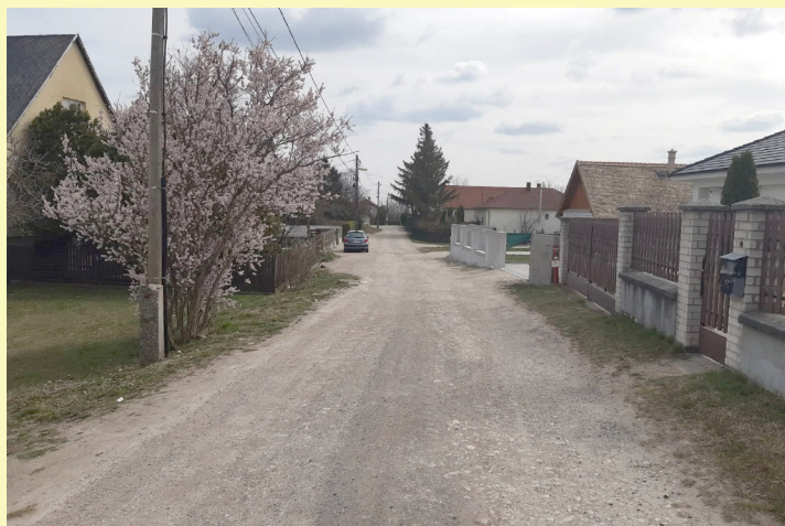
A villamoshálózat átépítését követően a Zrínyi utca burkolata is aszfaltborítást kaphat.

A Képviselő-testület a mellékutcák állapotának javítását is kiemelten kezeli, az elmúlt években közel 8 kilométernyi út zúzalékos burkolatát sikerült leaszfaltozni. De még nagyon sok utcánk vár a végleges kopóréteg kiépítésére.