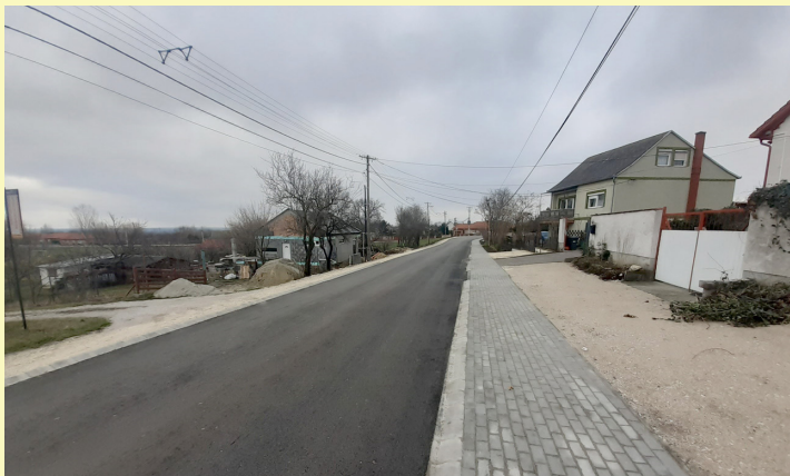
Reményeink szerint az idei évben folytatódhat a Kossuth utca felső szakaszának komplex felújítása.

A Kossuth utca felső szakasz komplex felújításának befejezése érdekében február 15-én pályázatot nyújtottunk be a Településfejlesztési Operatív Program (TOP-2.1.3-16) felhívásra. Bízva a pályázat pozitív elbírálásban, feltételes közbeszerzési eljárás lebonyolítása is megkezdődött a kivitelező kiválasztására. A pályázatról döntés májusban várható a kivitelezés a támogatási szerződés aláírását követően kezdődhet meg.