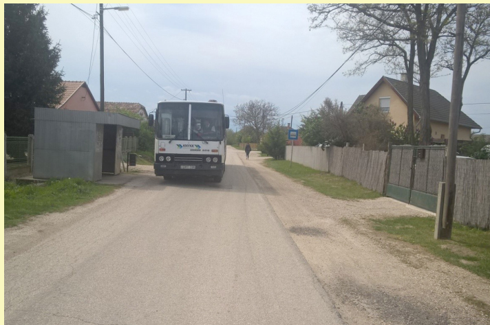
Dózsa utca jól látható a keskeny burkolat

A Belügyminisztérium által meghirdetett belterületi utak felújításának támogatására, pályázatot nyújtottunk be a tömegközlekedéssel érintett Dózsa utca útburkolatának szélesítésére. Dózsa utca a település közlekedésének fő tengelyét adó gyűjtő útként funkcionál, jelentős járműforgalmat viselő út. Az úton nem csak a személygépkocsi forgalom nagy, hanem a tömegközlekedés és tehergépjármű forgalom zajlik rajta.