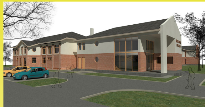
A 2008-ban tervezett iskola, a jelenlegi szabványoknak már nem felel meg.

lelőek. A jogszabályváltozás miatt jóval több helyiséget (pl. szaktantermek, szertárak, egyéb kiszolgáló) kell betervezni, valamint a tornaterem is közel a dupla méretű lesz, mint a korábban tervezett.