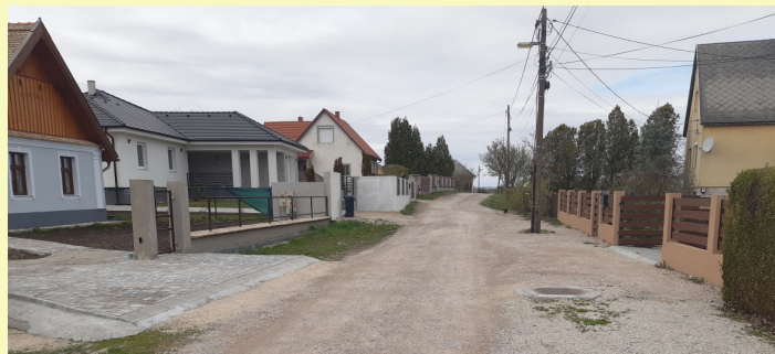
A zúzottkő burkolatú Zrínyi utca

A tervezett fejlesztés keretében három belterületi út, a Kőbányai utca, a Zrínyi Miklós utca, és a Jókai Mór utca burkolatának felújítását foglalja magában. A három felújításra kerülő út közül kettő utca, a Kőbányai, a Zrínyi utca zúzottkő burkolattal rendelkezik, míg a Jókai Mór utca italtott aszfalt makadám burkolatú. Közös jellemzőjük, hogy a burkolatok tönkrement, kikátyúsodtak, felületük egyenetlen, burkolatszélük leteredezett, részben eltűnt.