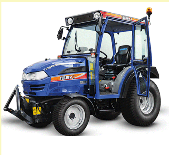
Pályázati támogatás elnyerése esetén beszerzésre kerülő eszköz ISEKI TH 5370 kompakt traktor

Úrhida Község Önkormányzat az alapvető közfeladatok ellátása céljából a belterületi közterület fenntartását biztosító eszközök beszerzését tervezi a belterületi közterületek megfelelő karbantartásához, közparkok, járdák, járda melletti zöldterületek, emlékhelyek fenntartásához, gondozásához.