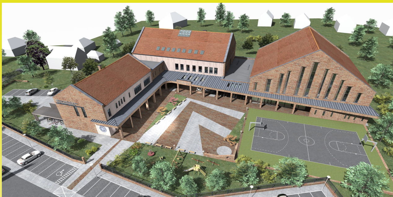
Az új iskola és tornaterem látványterve